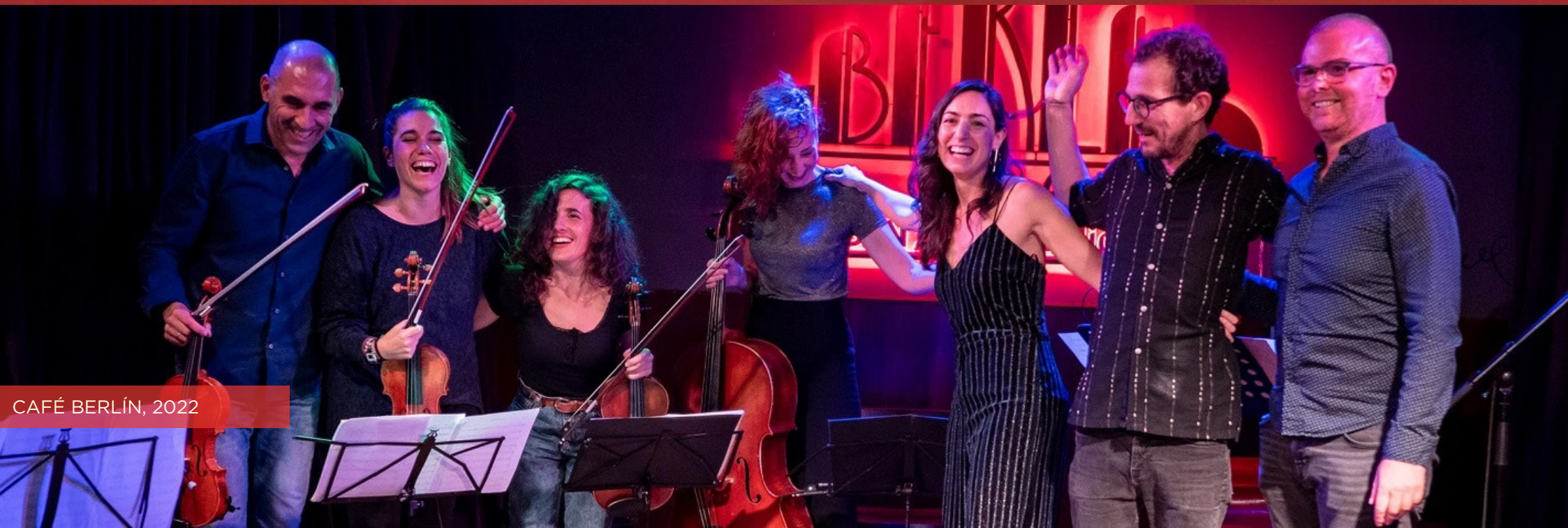
CAFÉ BERLÍN, 2022